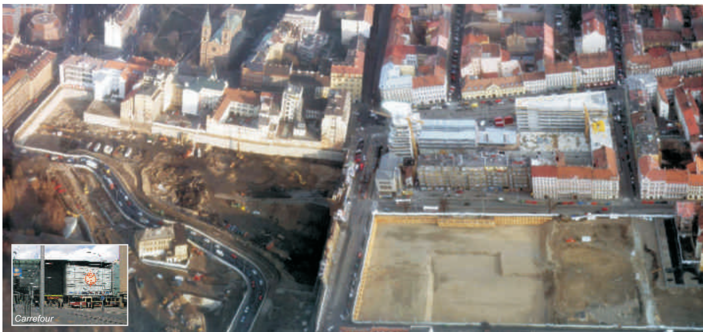
Letecký snímek velkoplošných stavebních jam pro KOC Smíchov o ploše 30 100 m 2 a pro ABC Smíchov 12 500 m 2