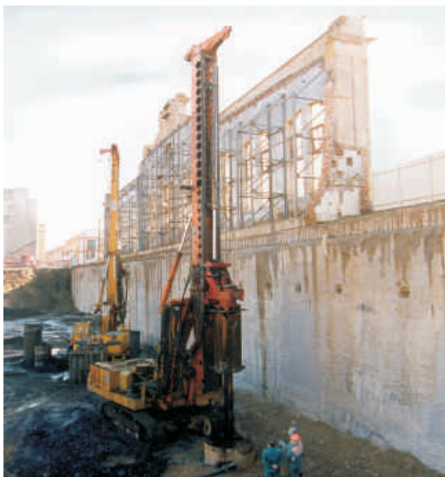
Vrtání základových velkopříměrých pilot