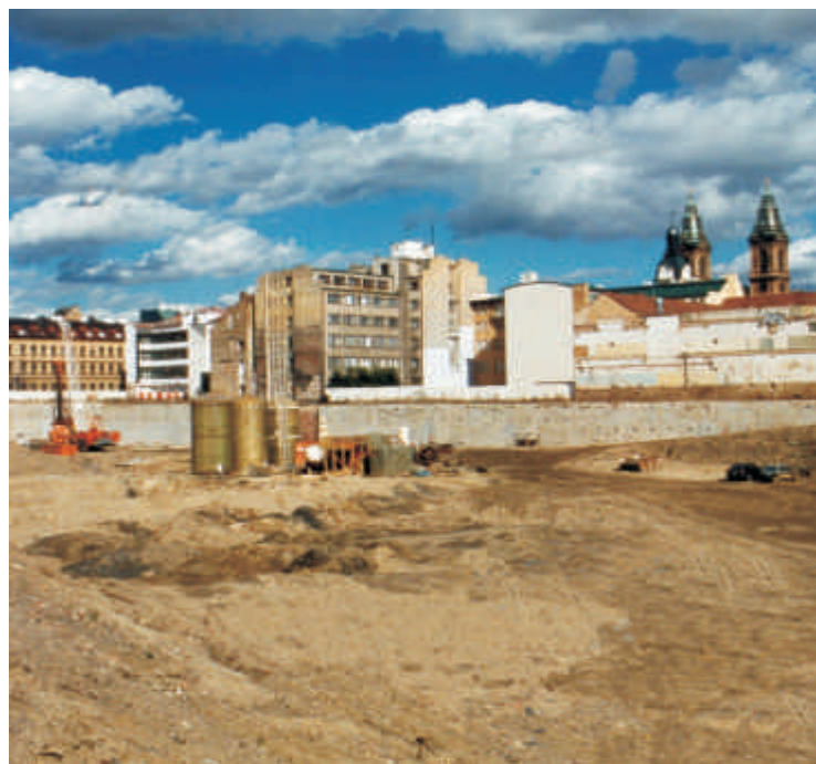
Stav výkopu stavební jámy v době vtání velkopříměrých pilot